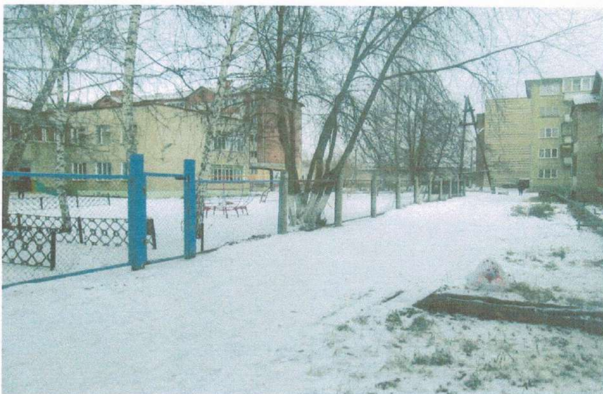
Вход в МДОУ Детский сад №6 с. Аргаяш