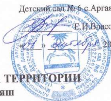
СХЕМА БЕЗОПАСНОГО ДВИЖЕНИЯ НА ТЕРРИТОРИИ МДОУ Детский сад №6 с.Аргаяш